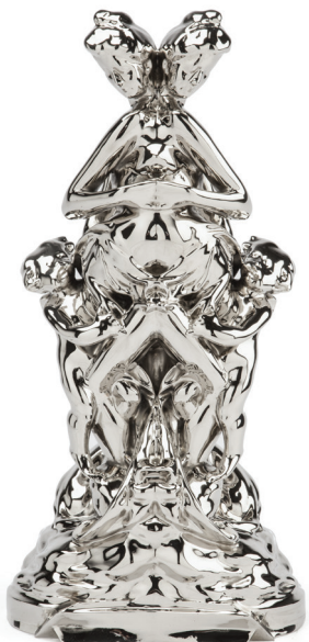
La Jeunesse Rorschach , 2013 nickelated bronze, 46.6 x 22.9 x 16.2 cm