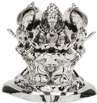
Rorschach Trinity , 2012 nickelated bronze, 33.5 x 32 x 30 cm