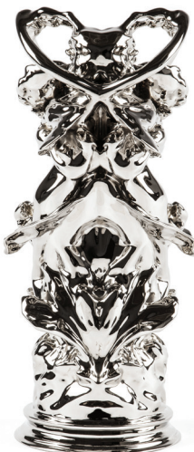
Daphnis & Chloë Rorschach III , 2012 nickelated bronze, 40 x 17.9 x 22.9 cm