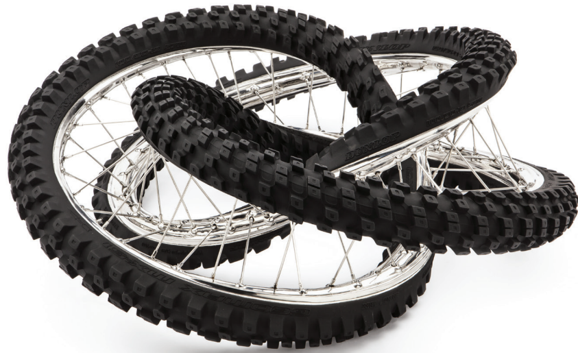
Dunlop Geomax 100/90-19 57 M 360° 3 X , 2012, polished and patinated stainless steel, 91.5 x 72 x 31 cm

ARNDT is pleased to present a solo show by the internationally renowned artist Wim Delvoye at Abu Dhabi Art 2014, where the gallery is exhibiting recent works from his coveted Gothic and Rorschach series, as well as new twisted-tire pieces that are perfectly fit for the desert terrain.