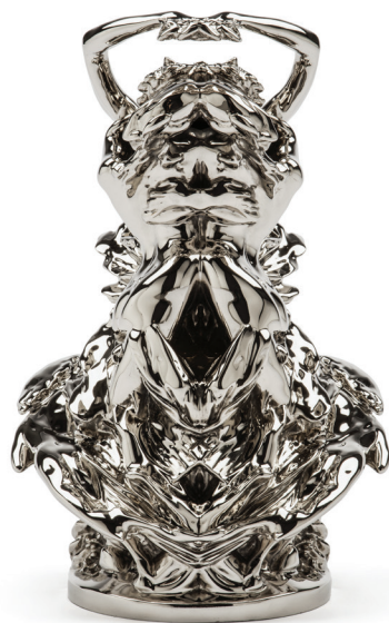
Le Secret Rorschach , 2012 nickelated bronze, 46 x 21 x 20 cm