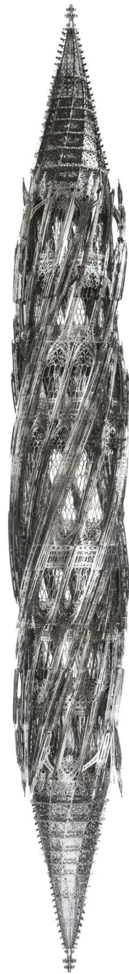
^ Suppo Penta (Clockwise), 2013, laser-cut stainless steel, 330 x 42 x 42 cm > Suppo, 2010, laser-cut stainless steel, 1100 x 129 x 130 cm Wim Delvoye au Louvre, 31.05.2012 – 17.09.2012, Musée du Louvre, Paris