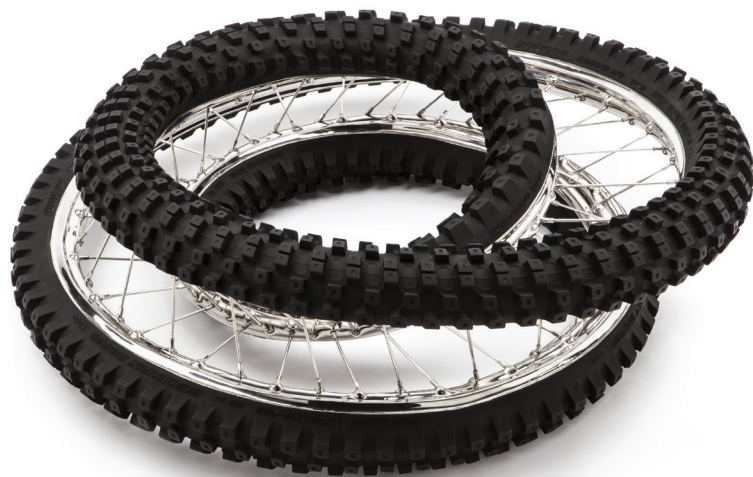
Dunlop Geomax 100/90-19 57 M 120° 3X , 2013 polished and patinated stainless steel, 87 x 87 x 27 cm