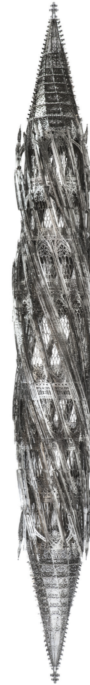
^ Suppo Penta (Counterclockwise), 2013, laser-cut stainless steel, 330 x 42 x 42 cm < Suppo, 2010, laser-cut stainless steel, 1100 x 129 x 130 cm Wim Delvoye, 01.03.2013 – 01.09.2013, San Cristoforo, Lucca